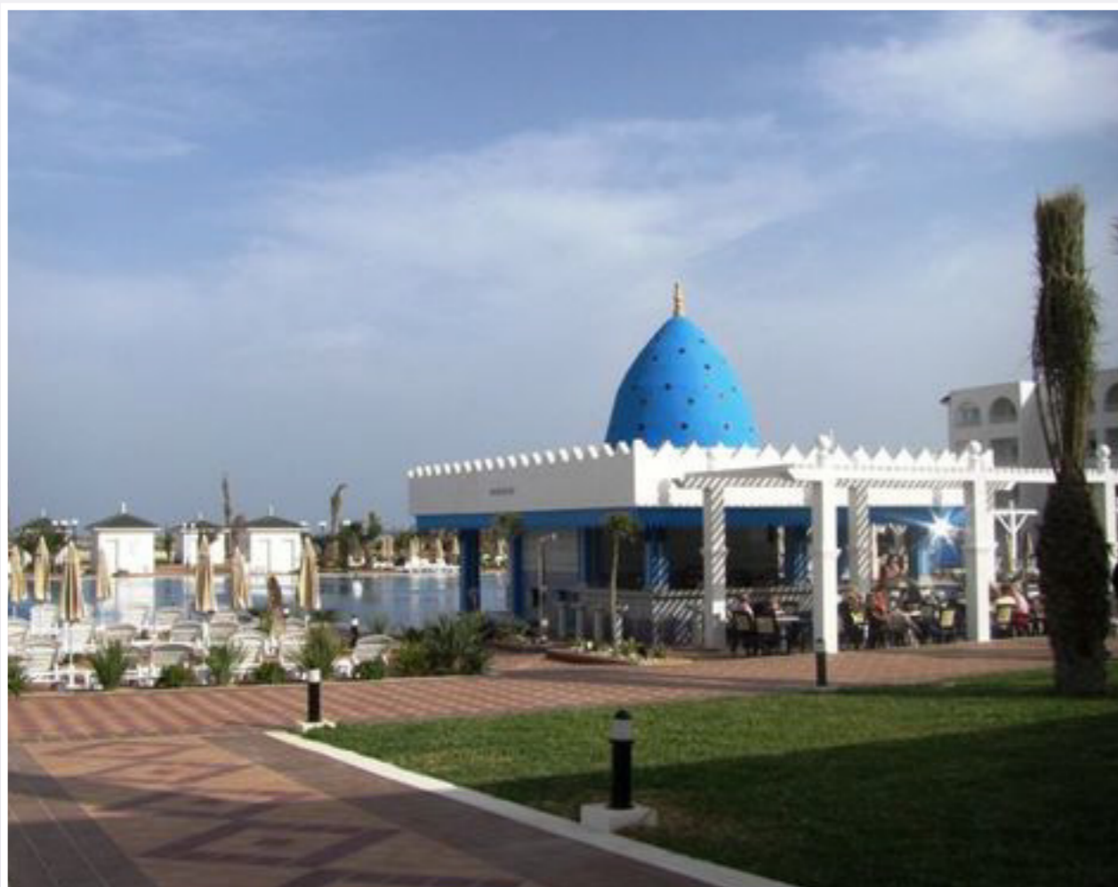
Бар у бассейна